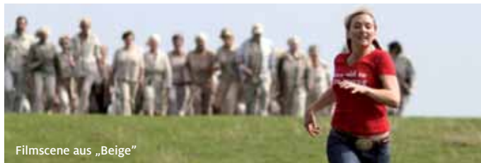
Filmscene aus „Beige“

! Die Eintrittsbändchen der KulturNacht gelten nur für das Angebot des Filmklubs, nicht für das reguläre Programm des Kino-Centers.